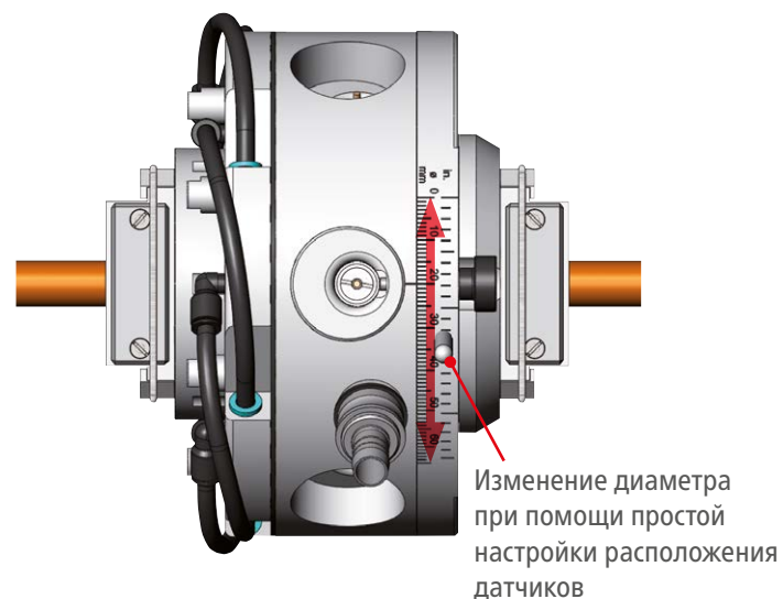
Изменение диаметра при помощи простой настройки расположения датчиков